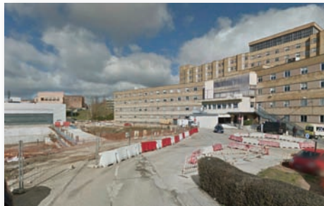
Obras en el Hospital de Salamanca

Salamanca sigue esperando su Hospital, mientras el resto están terminados