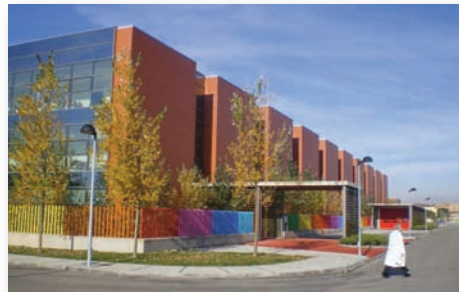
Nuevo Hospital Río Hortega de Valladolid