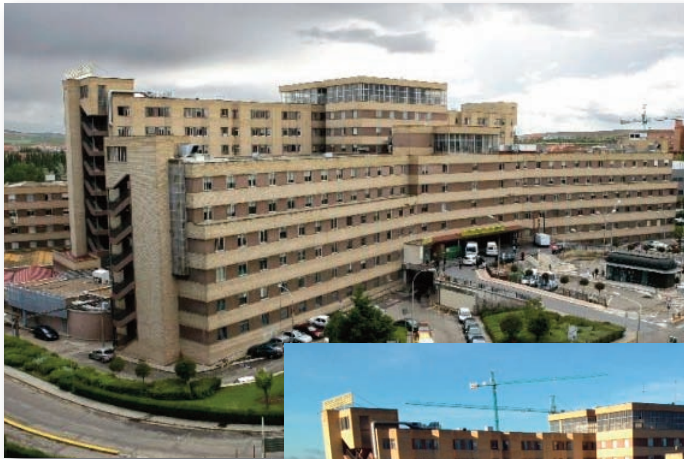
Hospital de Salamanca año 2006