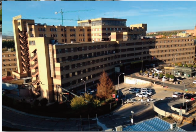
Hospital de Salamanca año 2014